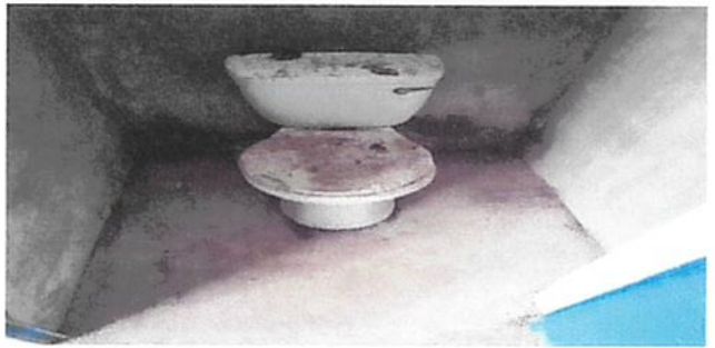
SUSTITUCIÓN DE INODORO