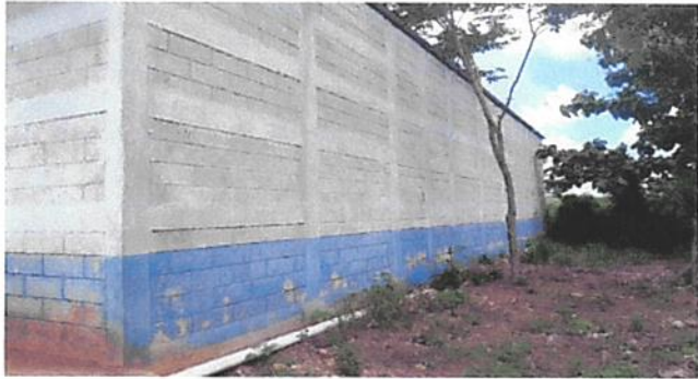
SUSTITUCIÓN DE TUBERÍA PVC LINEA PRINCIPAL AGUAS NEGRAS