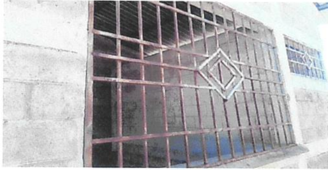
MANTENIMIENTO DE BALCON DE METAL