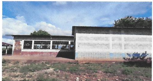
PINTURA EN MUROS EXTERIOR E INTERIOR

Observación: Si es necesario se pueden agregar hojas adicionales y utilizar el número de hojas.