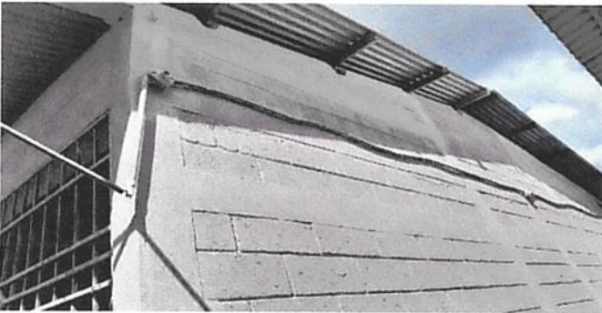
SUSTITUCIÓN DE DUCTO ELECTRICO MAS ACCESORIOS

Observación: Si es necesario se pueden agregar hojas adicionales actualizando el número de hojas.