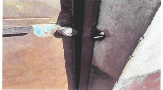
SUSTITUCIÓN DE CHAPA