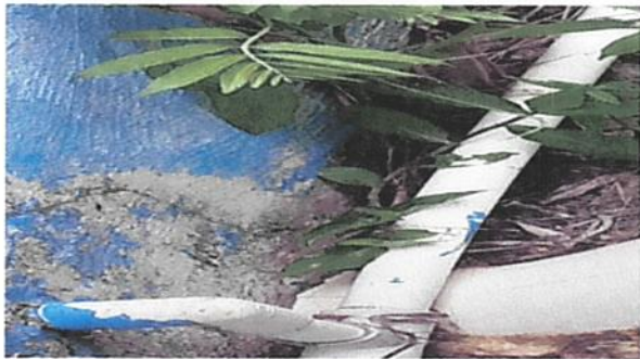
SUSTITUCIÓN DE TUBERIA LINEA PRINCIPAL