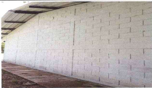
Foto 3 Pintura en muros exteriores e interiores