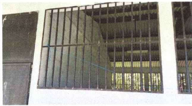
Foto1: Mantenimiento a balcones de metal