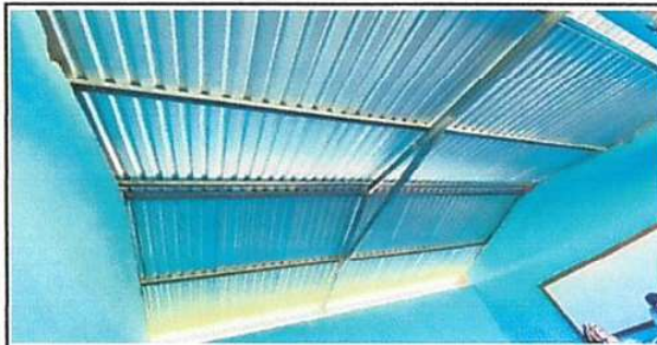
Foto 3: SUSTITUCION DE ESTRUCTURA DE SOPORTE DE MADERA, POR METAL.