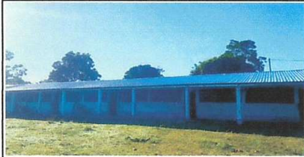
Foto1: SUSTITUCION DE LAMINA, POR LAMINA TROQUELADA ALUZINC CALIBRE 26