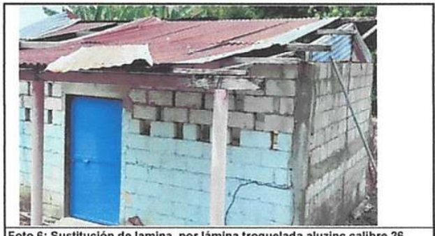
Foto 6: Sustitución de lamina, por lámina troquelada aluzinc calibre 26

Observación: Si es necesario se pueden agregar hojas adicionales y actualizar el número de hojas.