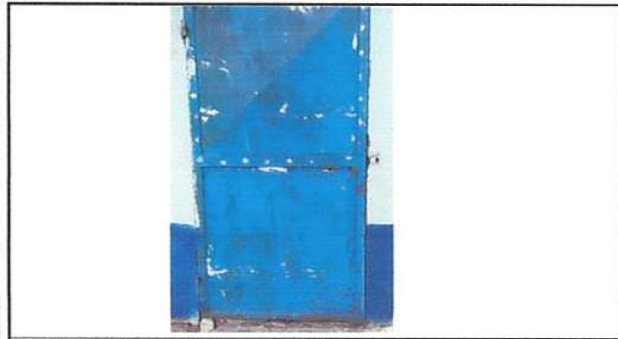
Foto1: Sustitución de puertas de Metal