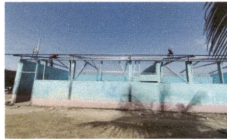
Foto 2: Sustitución de estructura de soporte de madera, por metal