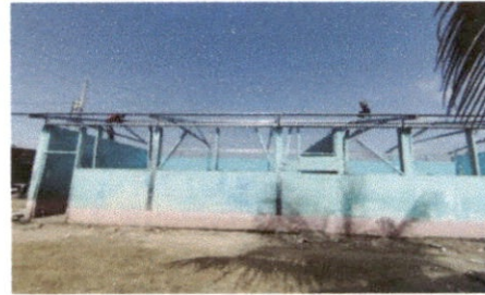
Foto 2: Sustrucción de estructura de soporte de madera, por metal