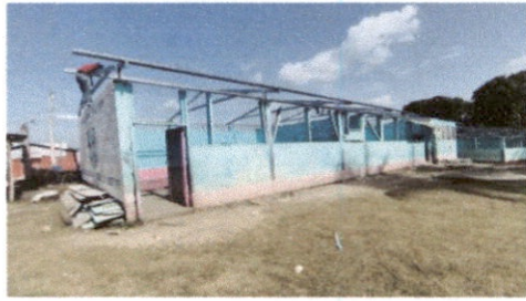
Foto1: Sustitución de lamina, por lamina troquelada aluzinc calibre 26 modulo de aulas y direccion