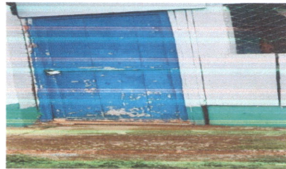
SUSTITUCIÓN DE PUERTA