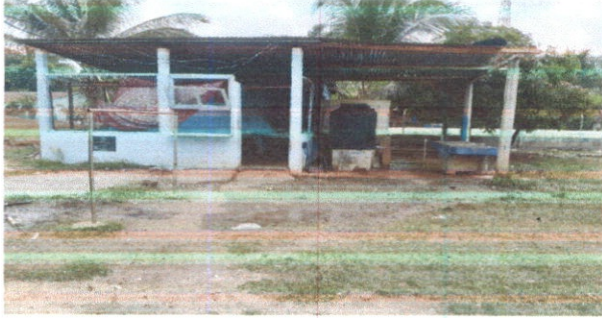
SUSTITUCIÓN DE LAMINA POR LAMINA TROQUELADA ALUZINC CALIBRE 26