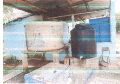
SUSTITUCIÓN DE DEPOSITO DE AGUA 1,700 LITROS