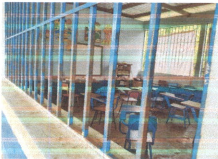
SUSTITUCIÓN DE BALCON