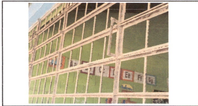
Mantenimiento a balcones de metal.

Observación: Si es necesario se pueden agregar hojas adicionales y actualizar el número de hojas.