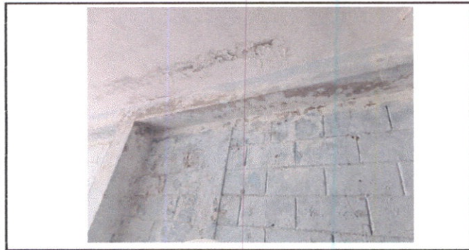
Pintura en muros exteriores e interiores.