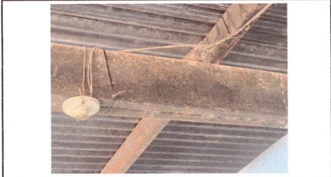
Mantenimiento de estructura de soporte de metal.