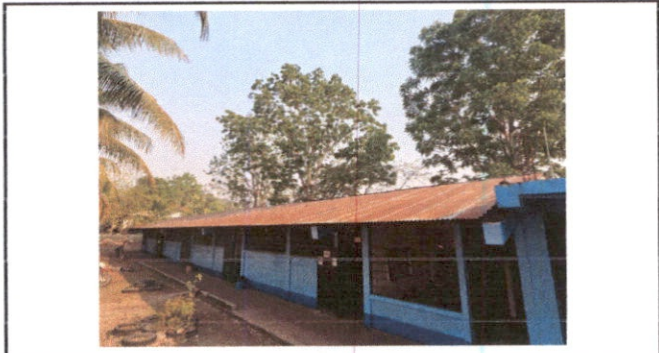
Sustitución de lámina, por lámina troquelada aluzinc calibre 26, sustitución de capote de lámina para lámina troquelada, sustitución de elementos de fijación.