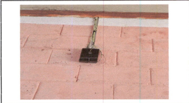
Sustitución de tablero y flipon.