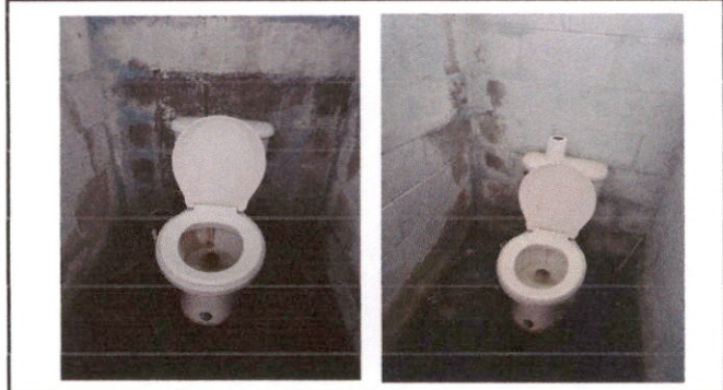
Sustitución de Inodoro.