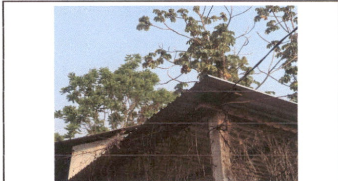
Reparación de cableado eléctrico de tablero y flipon.