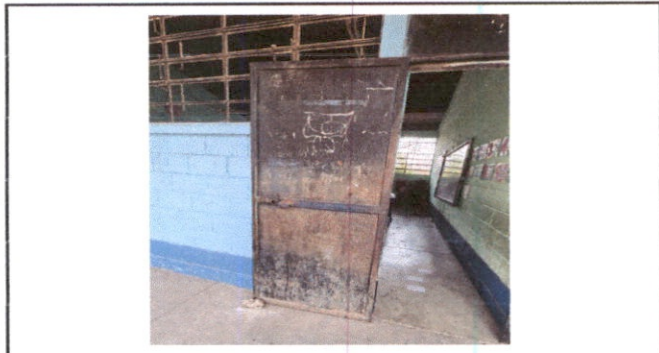
Mantenimiento a estructura de puertas de metal, sustitución de una puerta.