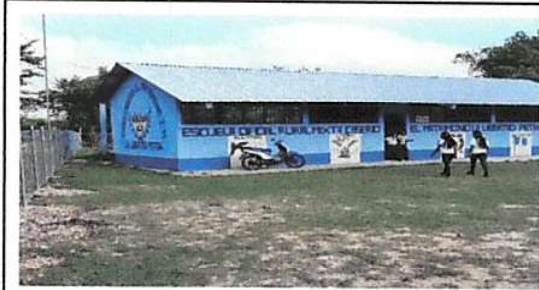
Foto 1: Sustitución de lamina, por lamina troquelada aluzinc calibre 26 modulo de aulas