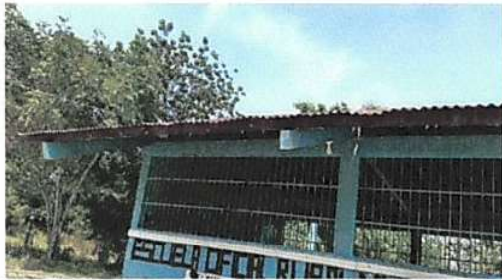
Foto1: Sustitución de lamina, por lamina troquelada aluzinc calibre 26 modulo de aulas