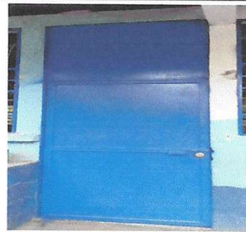
Foto 4: MANTENIMIENTO A ESTRUCTURA LIJADO, CAMBIO DE TUBO, CEPILLADO SUJECIONES, APLICACIÓN DE PINTURA