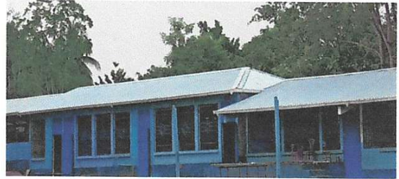
Foto 2: SUSTITUCIÓN DE LÁMINA POR LÁMINA TROQUELADA ALUZINC CALIBRE 26