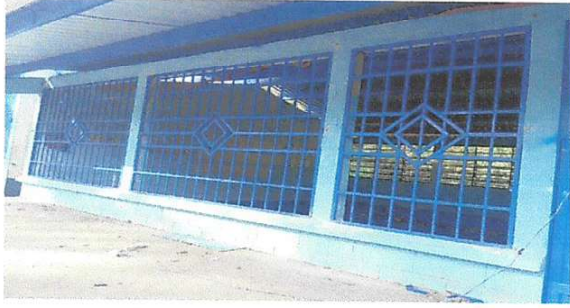
Foto7: SUSTITUCIÓN DE BALCÓN DE METAL