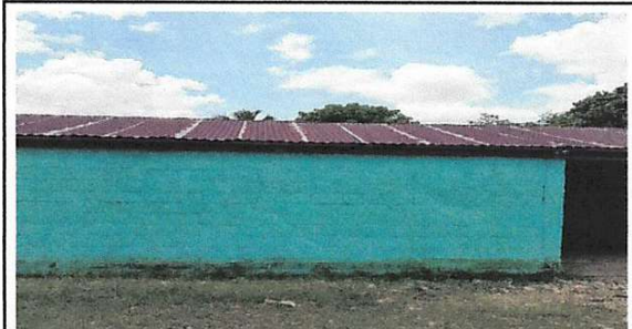
Foto 4: Sustitución de lámina, por lámina troquelada aluzinc calibre 26