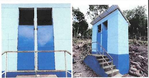
Foto 4: MANTENIMIENTO A ESTRUCTURA (LIJADO, CAMBIO DE TUBO, CEPILLADO, SUJECIONES, APLICACIÓN DE PINTURA A PUERTA EN SERVICIOS SANITARIOS