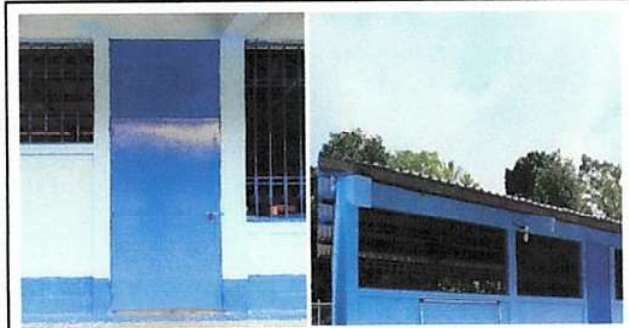
Foto 3: MANTENIMIENTO A ESTRUCTURA (LIJADO, CAMBIO DE TUBO, CEPILLADO, SUJECIONES, APLICACIÓN DE PINTURA