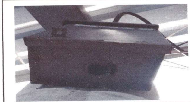
sustitución de Flipones

Observación: Si es necesario se pueden agregar hojas adicionales y actualizar el número