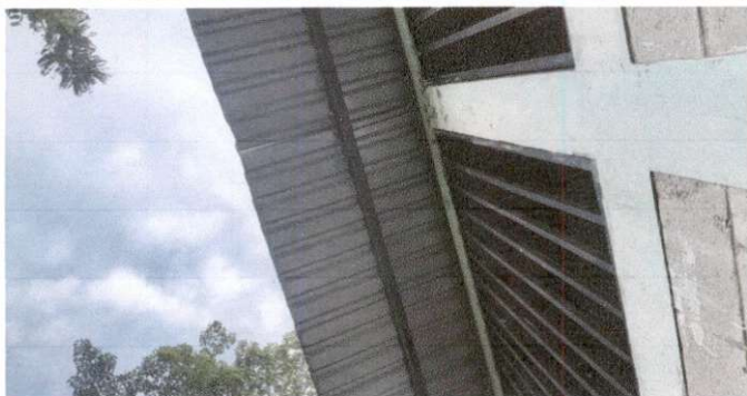
Foto 1: Sustrucción de laminas por lamina troquelada aluzinc calibre 26