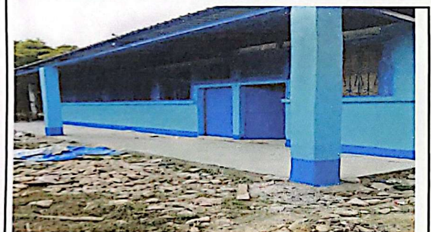
REPARACIONES DE COLUMNAS DE MADERA POR CONSTRUCCIÓN