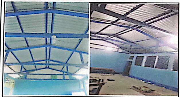
REPARACION DE LAMPARAS