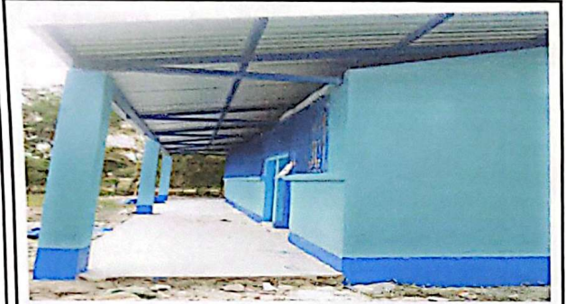
REPARACION DE PISO DE CEMENTO LIQUIDO