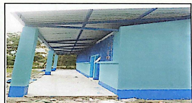
PINTURA EN MUROS INTERIOR EXTERIOR