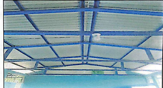
DESINSTALACIÓN DE TECHO