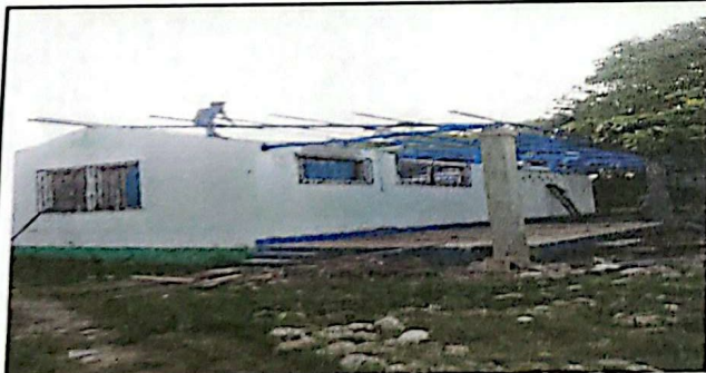
REPARACION DE ESTRUCTURA DE MADERA POR METAL