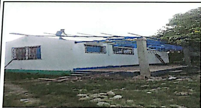
REPARACION DE ESTRUCTURA DE MADERA POR METAL