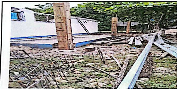
REPARACIONAS DE COLUMNAS DE MADERA POR CONSTRUCCIÓN