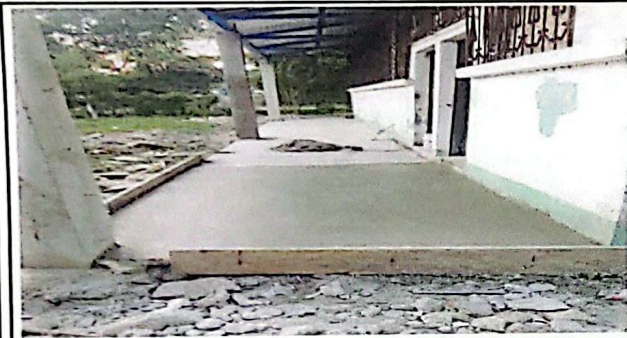
REPARACION DE PISO DE CEMENTO LIQUIDO