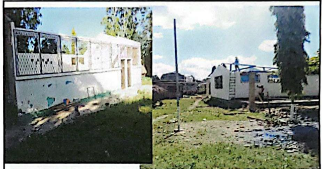
DESINSTALACIÓN DE TECHO