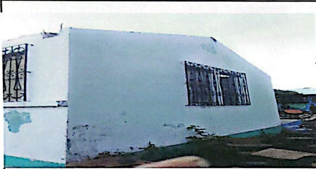
REPARACION DE PISO DE CEMENTO LIQUIDO