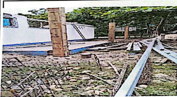
REPARACIONAS DE COLUMNAS DE MADERA POR CONSTRUCCIÓN