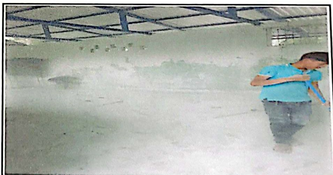
PINTURA EN MUROS INTERIOR EXTERIOR

Observación: Si es necesario se pueden agregar hojas adicionales y actualizar el número de hojas.