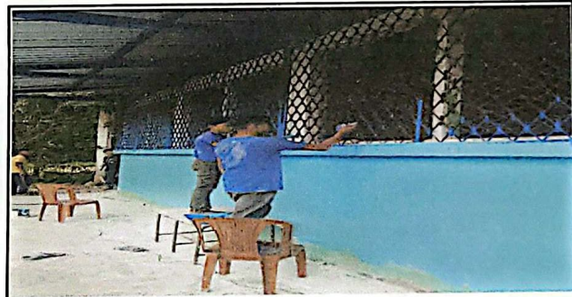
PINTURA EN MUROS INTERIOR EXTERIOR