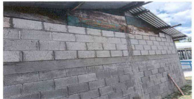
FIGURA 6: Pintura en muros exterior e interior

Observación: Si es necesario se pueden agregar hojas adicionales y actualizar el número de hojas.