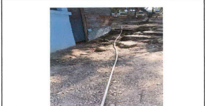
FIGURA 8: Sustitución de tubería principal de pvc