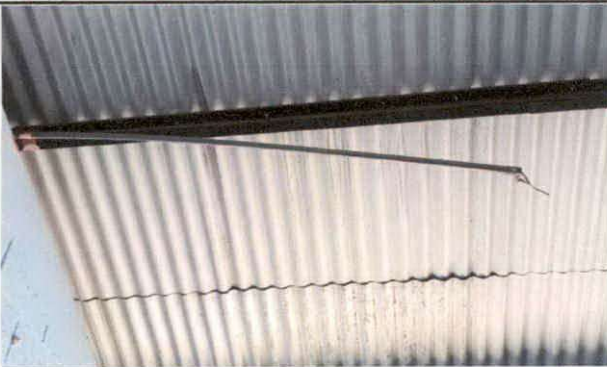
FIGURA 18: Sustitución de ducto eléctrico + accesorios

Observación: Si es necesario se pueden agregar hojas adicionales y actualizar el número de hojas.