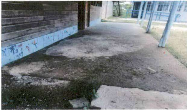
FIGURA 3: Reparación de piso de torta de concreto