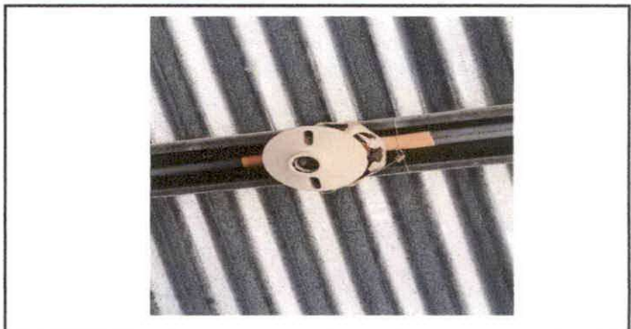
FIGURA 12: Sustitución de plafoneras

Observación: Si es necesario se pueden agregar hojas adicionales. Actualizar el número de hojas.