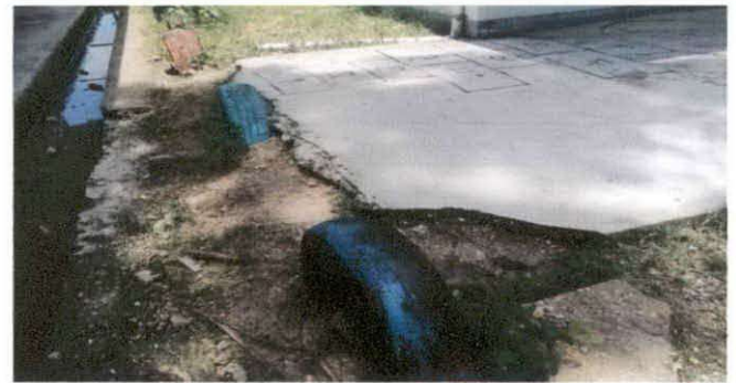
FIGURA 4: Reparación de planchas de concreto de patio