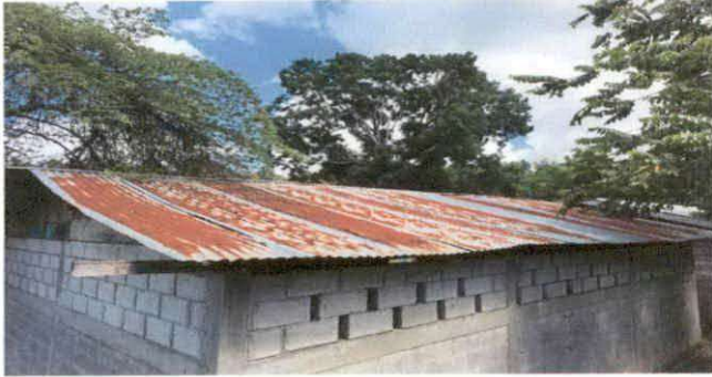
FIGURA 1: Sustitución de lámina, por lámina troquelada aluzinc calibre 26