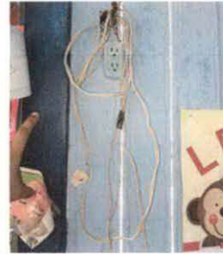
FIGURA 17: Sustitución de tomacorrientes