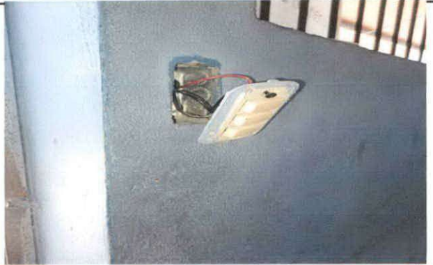
FIGURA 14: Sustitución de interruptores dobles