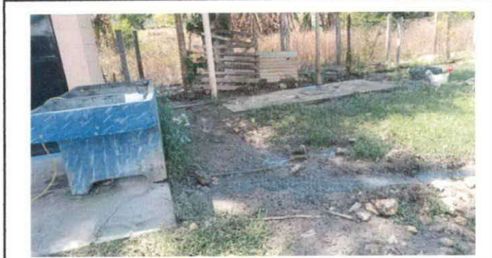
FIGURA 7: Sustitución de pila de cemento de dos lavaderos