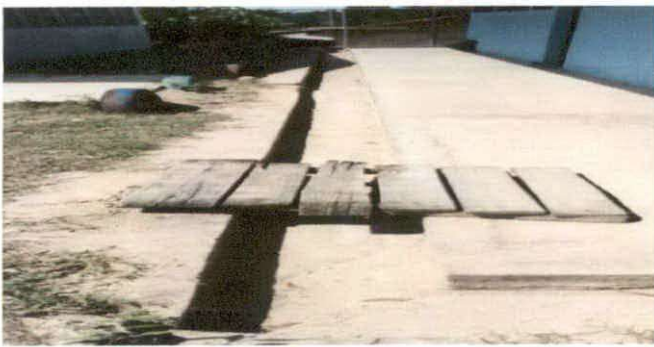
FIGURA 5: Reparación de cuneta de concreto