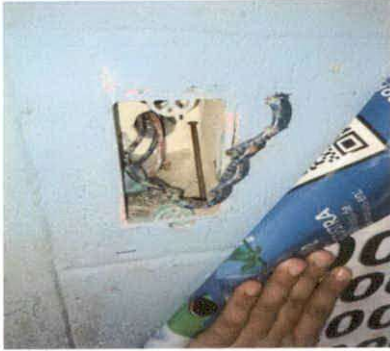
FIGURA 13: Sustitución de interruptores simples