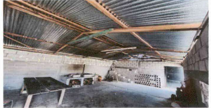
FIGURA 2: Sustitución de estructura de soporte de madera, por metal