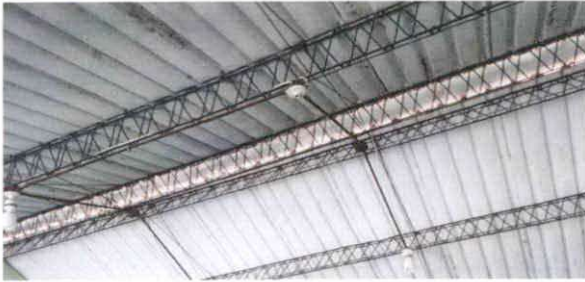
FIGURA 16: Sustitución de focos ahorradores