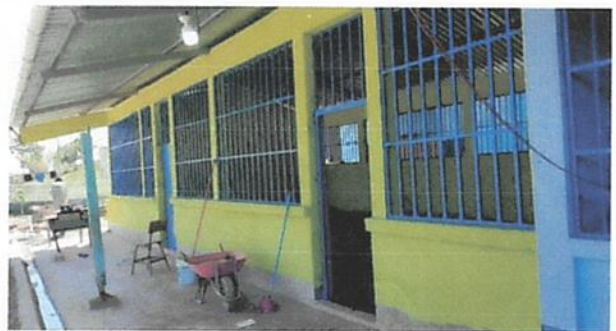
SUSTITUCIÓN DE PLAFONERAS

Observación: Si es necesario se pueden agregar hojas adicionales y actualizar el número de hojas.