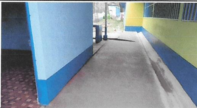
REPARACIÓN DE CUNETAS DE CONCRETO

Observación: Si es necesario se pueden agregar hojas adicionales y actualizar el número de hojas.