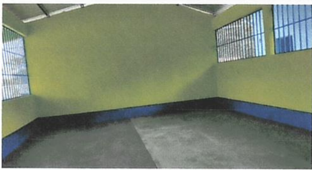
SUSTITUCIÓN DE PISO DE TORTA DE CONCRETO