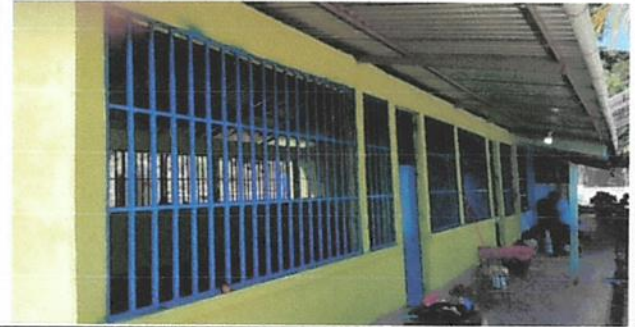
FABRICACIÓN E INSTALACIÓN DE BALCON DE METAL EN VENTANA