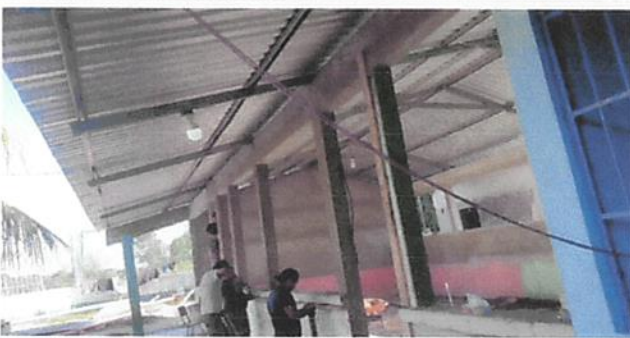
SUSTITUCIÓN DE CABLEADO PRINCIPAL