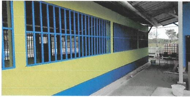
PINTURA EN MURO EXTERIOR E INTERIOR