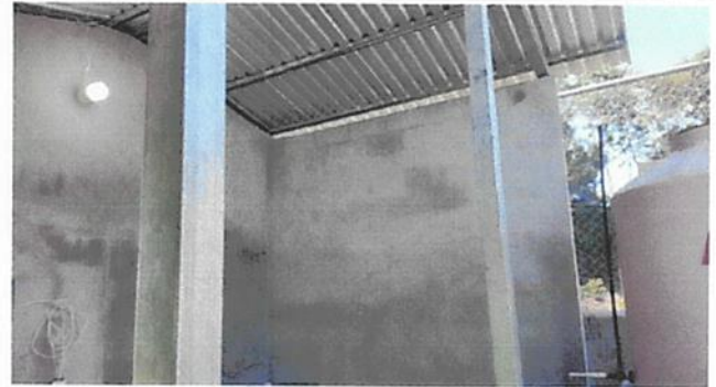
SUSTITUCIÓN DE FOCOS AHORRADORE