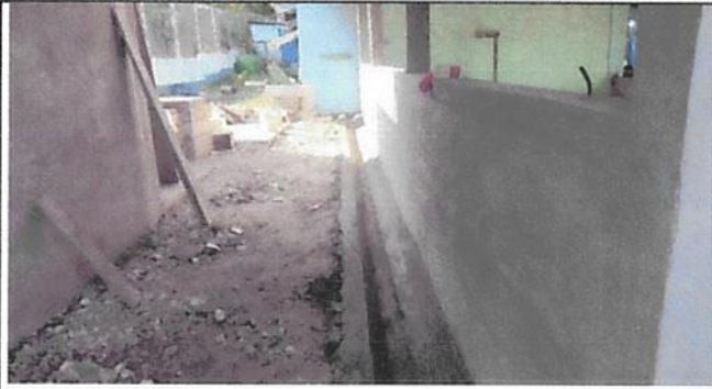
REPELLO EN MURO