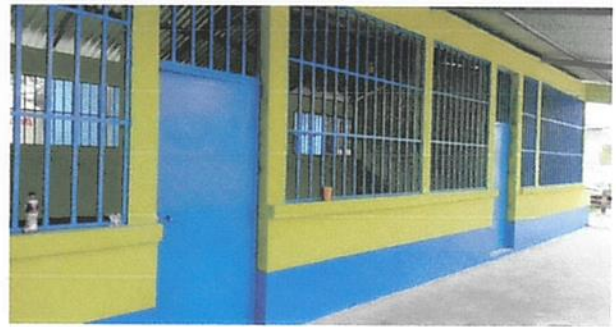
SUSTITUCIÓN DE PUERTAS