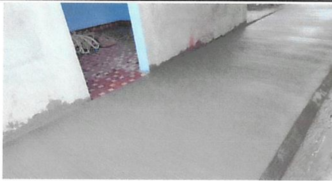
SUSTITUCIÓN DE PISO DE TORTA DE CONCRETO