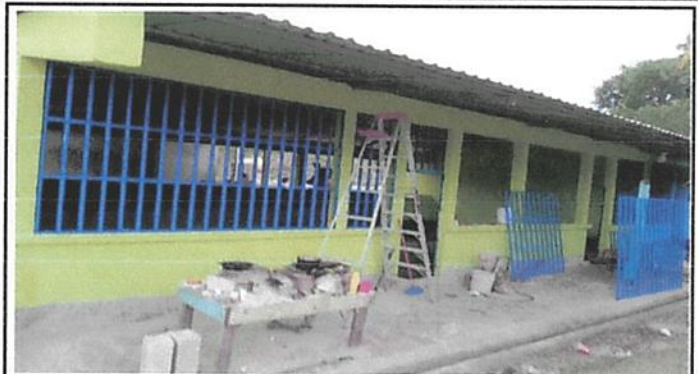
FABRICACIÓN E INSTALACIÓN DE BALCON DE METAL EN VENTANA