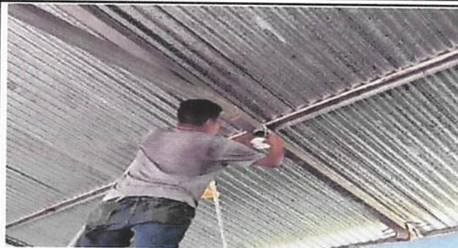
SUSTITUCIÓN DE FOCOS AHORRADORE