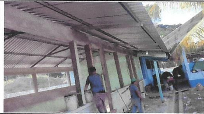
REPELLO EN MURO