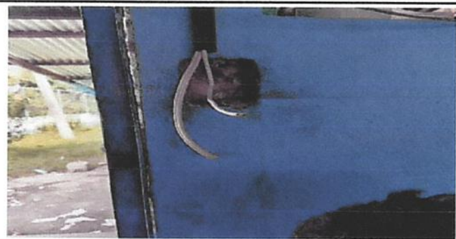
SUSTITUCIÓN DE CABLEADO PRINCIPAL