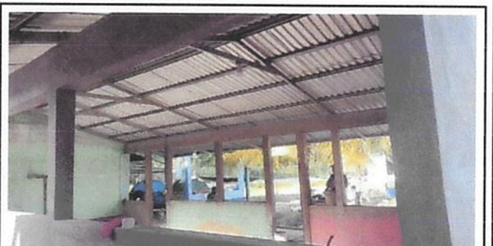
SUSTITUCIÓN DE PLAFONERAS

Observación: Si es necesario se pueden agregar hojas adicionales y actualizar el número de hojas.