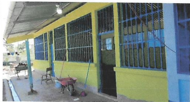
PINTURA EN MURO EXTERIOR E INTERIOR