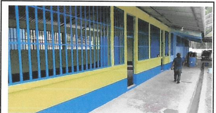
SUSTITUCIÓN DE PUERTAS