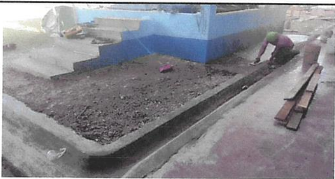
REPARACIÓN DE CUNETAS DE CONCRETO

Observación: Si es necesario se pueden agregar hojas adicionales y actualizar el número de hojas.