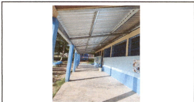
Foto 4: Estructura de metal en el corredor de las aulas terminado