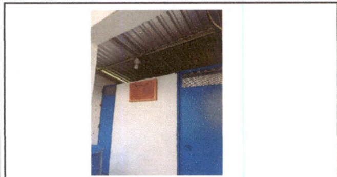
Foto1: puertas de metal del baño y la estructura de metal del techo y lamina dentro del baño