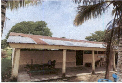
Foto1: Lado frontal de aula