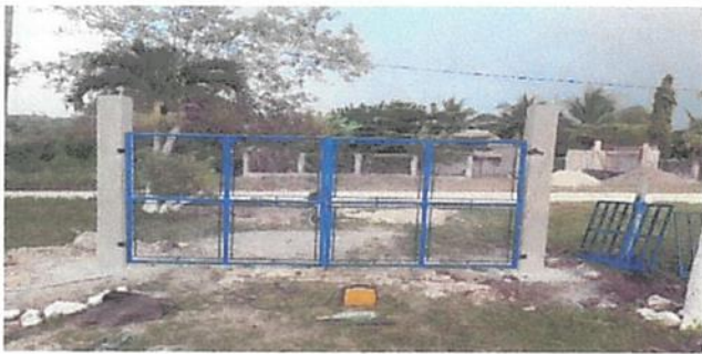
SUSTITUCIÓN DE PORTÓN