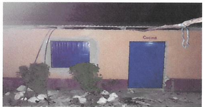
SUSTITUCION DE VENTANA DE MADERA POR METAL

Observación: Si es necesario se pueden agregar hojas adicionales y actualizar el número de hojas.