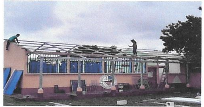
SUSTITUCIÓN DE ESTRUCTURA DE SOPORTE DE MADERA, POR METAL