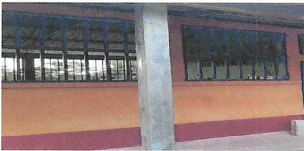
SUSTITUCION DE BALCONES DE METAL EN VENTANA