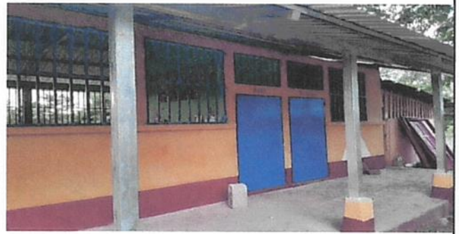
SUSTITUCIÓN DE PUERTAS