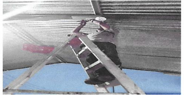
SUSTITUCIÓN DE PLAFONERAS