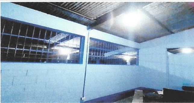
SUSTITUCIÓN DE LAMPARAS AHORRADORAS