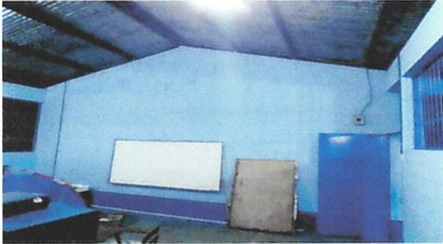
SUTITUCIÓN DE PUERTAS