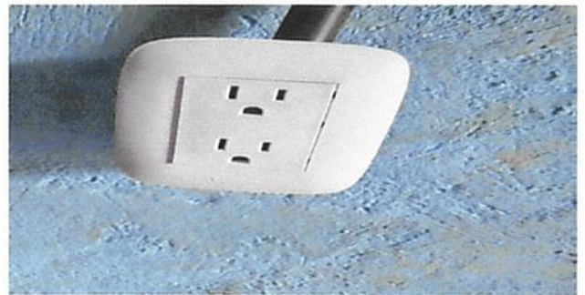
SUSTITUCIÓN DE TOMACORRIENTES DOBLES

Observación: Si es necesario se pueden agregar hojas adicionales y actualizar el número de hojas.