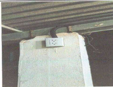
Figura 11: Sustitución de tomacorrientes dobles