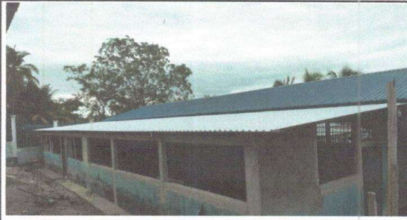
Figura 1: Sustitución de lámina, por lámina troquelada aluzinc calibre 26