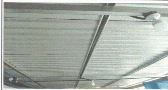
Figura 2: Sustitución de estructura de soporte de madera, por metal