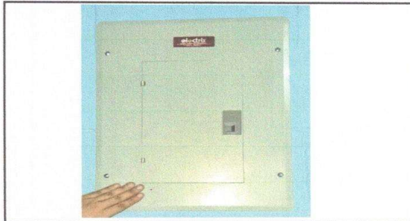
Figura 4: Instalación de tablero y flipones