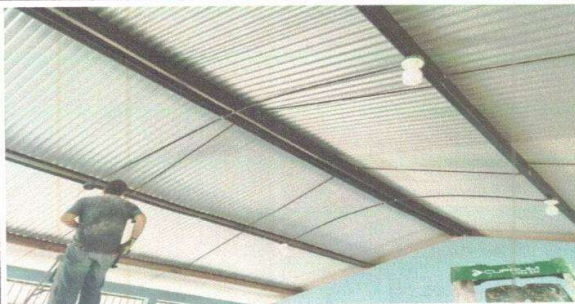
Figura 9: Sustitución de plafoneras