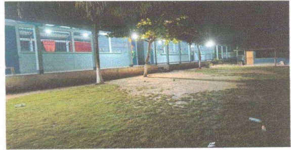
Figura 10: Sustitución de focos ahorradores