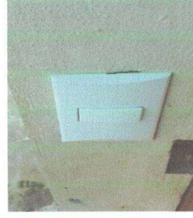
Figura 8: Sustitución de Interruptores simples