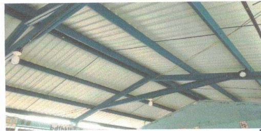
Figura 12: Sustitución de ducto eléctrico + accesorios

Observación: Si es necesario se pueden agregar hojas adicionales y actualizar el número de hojas.