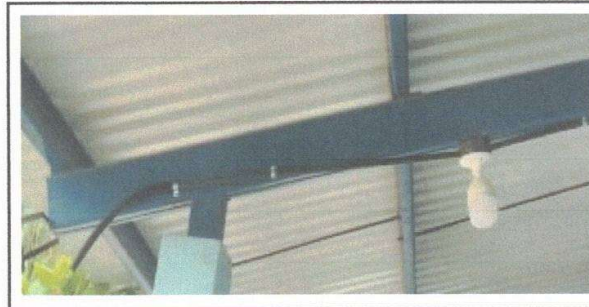
Figura 6: Reparación de cableado eléctrico

Observación: Si es necesario se pueden agregar hojas adicionales y actualizar el número de hojas.