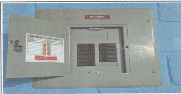
Figura 5: Sustitución de flipones