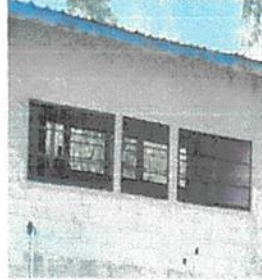
Foto1: cambio ventanales de enfrente y atrás.