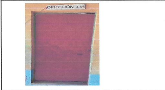
Foto 4: Necesita mantenimiento la puerta de la direccion cambio de pintura..