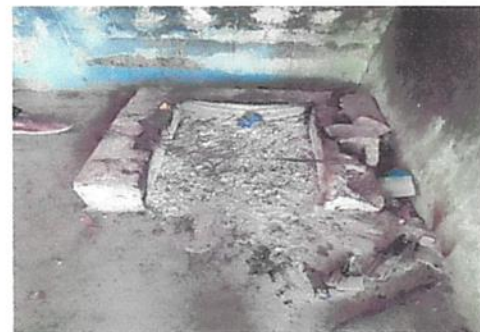
mantenimiento a estufs rural

Observación: Si es necesario se pueden agregar hojas adicionales. Actualizar el número de hojas.