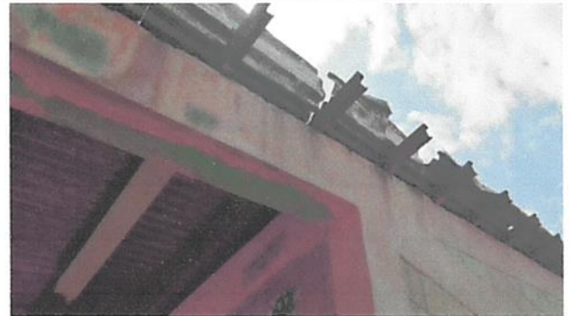
ssustitución de enlaminado.