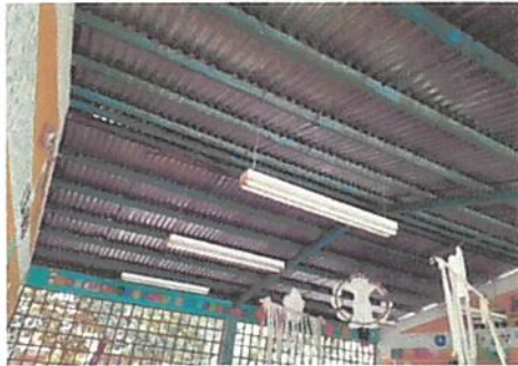
Reparación de cableado principal y sustitución de plafoneras.