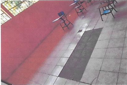
sustitucion de piso ceramico