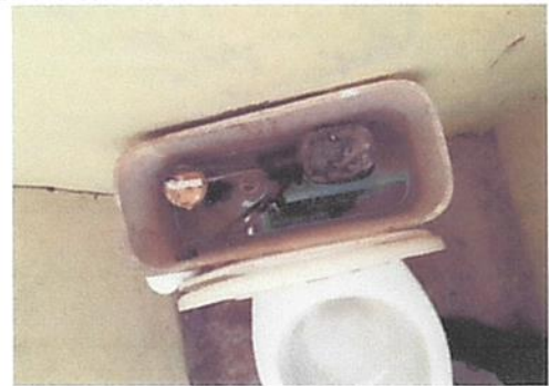
sustitucion de accesorios de inodoro