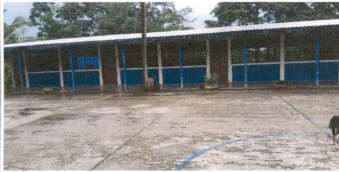
Foto1: Sustitución de lámina por lámina troquelada aluzinc calibre 26