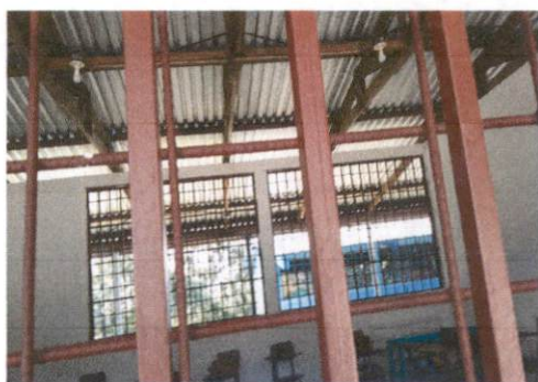
Foto 3: Mantenimiento a estructura (alijado, cambio de tubo, cepillado, sujeciones, aplicación de pintura)