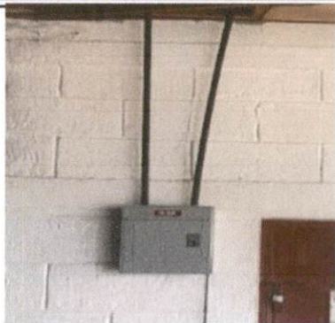
Foto1: Sustrucción de Flipones