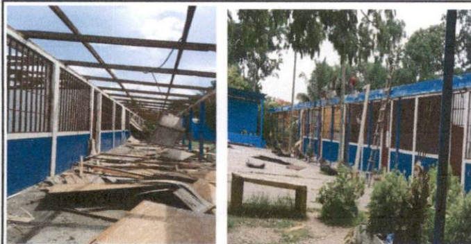
Foto1: Desinstalación de lamina existente