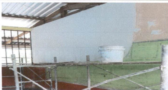
Foto1: Pintura en muros exterior e interior