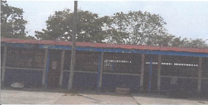
1.1 SUSTITUCIÓN DE LÁMINA, POR LÁMINA TROQUELADA ALUZINC CALIBRE 26