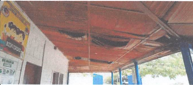
2.3 SUSTITUCIÓN DE ESTRUCTURA DE SOPORTE DE METAL, POR METAL. SUSTITUCIÓN DE CAPOTE DE LÁMINA. SUSTITUCIÓN DE ELEMENTOS DE FIJACIÓN.

Observación: Si es necesario se pueden agregar hojas adicionales y actualizar el número de hojas.