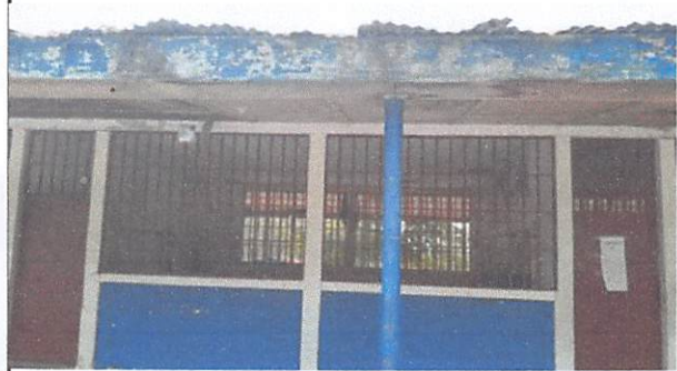
5.7 MANTENIMIENTO A BALCONES DE METAL