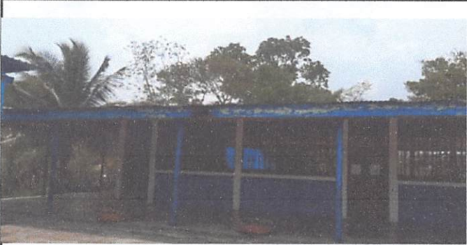
9.1 PINTURA EN MUROS EXTERIORES E INTERIORES