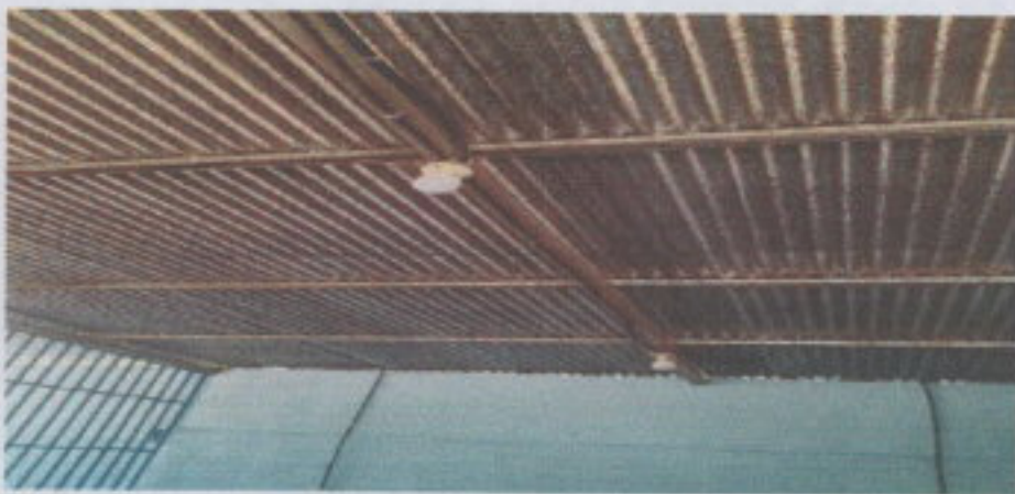
SUSTITUCIÓN DE DUCTO ELÉCTRICO + ACCESORIO