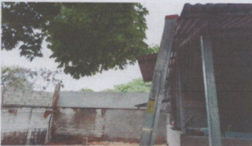
SUSTITUCIÓN DE LAMINA TROQUELADA ALUZINC CALIBRE 26