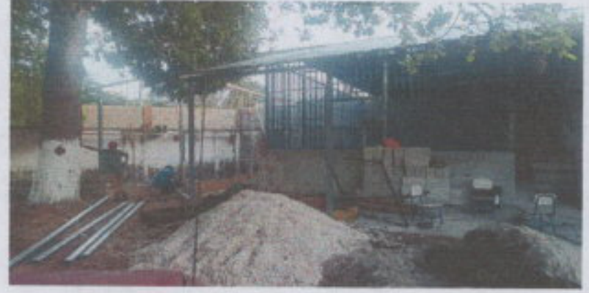
SUSTITUCIÓN DE ESTRUCTURA DE METAL POR METAL