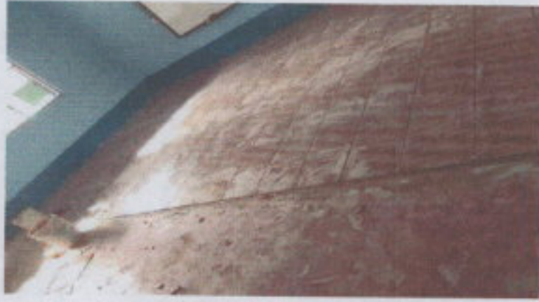
SUSTITUCIÓN DE CERÁMICA