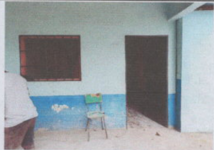
SUSTITUCIÓN DE VENTANA DE MADERA POR METAL MAS VIDRIO