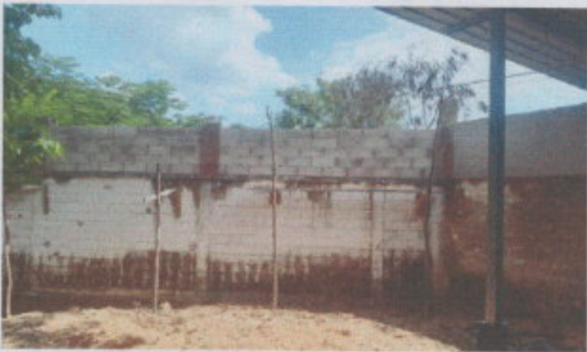
REPARACIÓN DE MURO PERIMETRAL MAS BLOCK