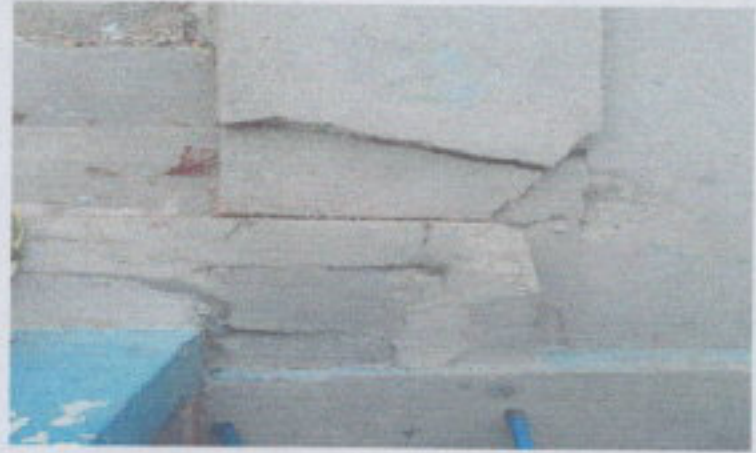
CERNIDO EN MURO