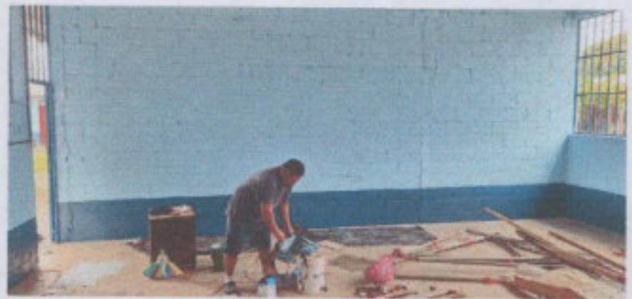
PINTURA EN MURO EXTERIOR E INTERIOR