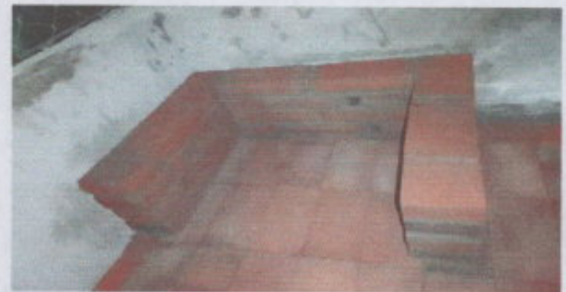
MANTENIMIENTO EN ESTUFA RURAL

Observación: Si es necesario se pueden agregar fotos para actualizar el número de hojas.