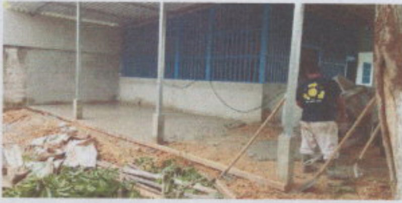
SUSTITUCIÓN DE BALCON DE METAL POR METAL