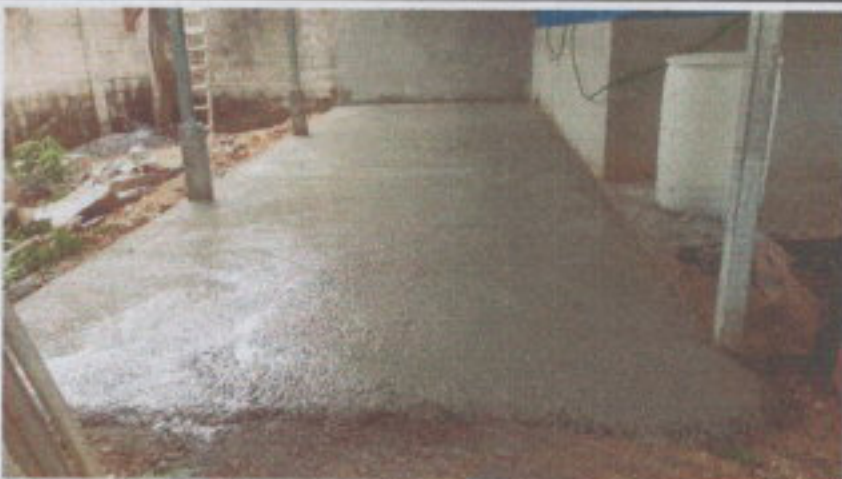
SUSTITUCION DE TORTA DE CONCRETO