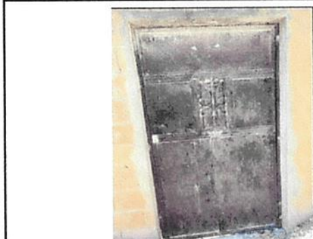
Foto 1: PUERTA ACCESO PRINCIPAL A LA ESCUELA 4.1 Mantenimiento a estructura (lijado, cambio de tubo , cepillado, sujeciones, aplicación de pintura)