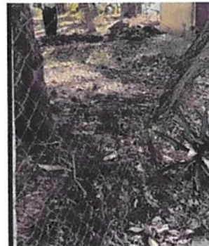
Foto 2: 15 MURO. 15.3 Reparación de tubo hg y malla galvanizada. (Cercado del predio de la escuela).