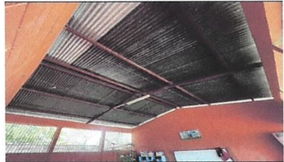
Foto 8: (Aula 2) 2.3 Sustitución de estructura de soporte de metal, por metal.