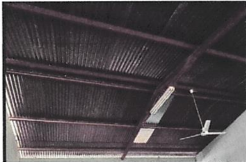
Foto 9: (Aula 1) 2.3 Sustitución de estructura de soporte de metal, por metal.

Observación: Si es necesario se pueden agregar hojas adicionales y adjuntar el registro de hojas.