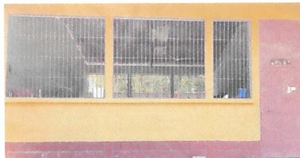
Foto 4: (Aula 1 Ventana) 5.2 Sustitución de estructura de metal de ventana. (Aula 1 Puerta)4.1 Mantenimiento a estructura (lijado, cambio de tubo , cepillado, sujeciones, aplicación de pintura)