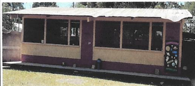
Foto 3: 1.1 Sustitución de lámina, por lámina troquelada aluzinc calibre 26