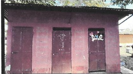
Foto7: Puerta de los baños. 4.1 Mantenimiento a estructura (lijado, cambio de tubo , cepillado, sujeciones, aplicación de pintura)