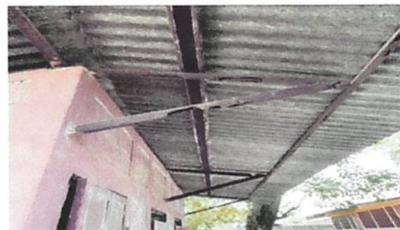
Foto 6: Foto 6: 2.3 Sustitución de estructura de soporte de metal, por metal. (Área de los baños).