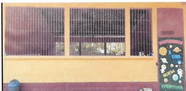
Foto 5: (Aula 2 Ventana) 5.2 Sustitución de estructura de metal de ventana. (Aula 2 Puerta)4.1 Mantenimiento a estructura (lijado, cambio de tubo , cepillado, sujeciones, aplicación de pintura)