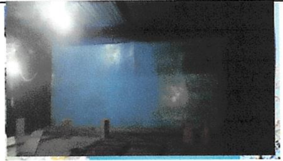
Foto 2: Sustitución de lámina, por lamina troquelada aluzinc calibre 26