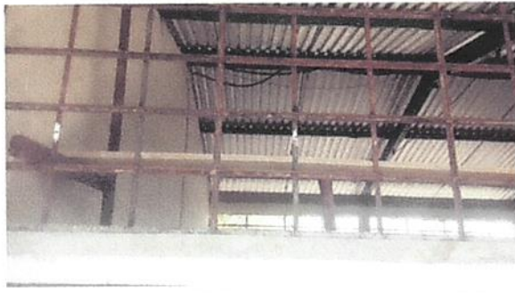
Foto1: Mantenimiento de Barrandas de Metal M2