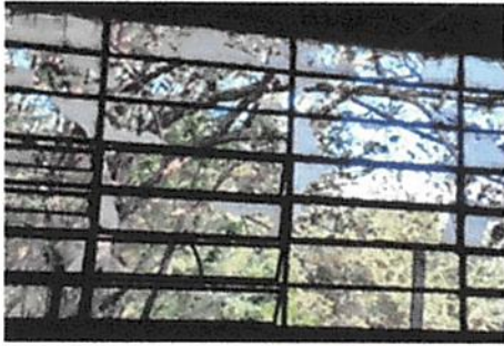
Foto1: Mantenimiento de Barrandas de Metal M2