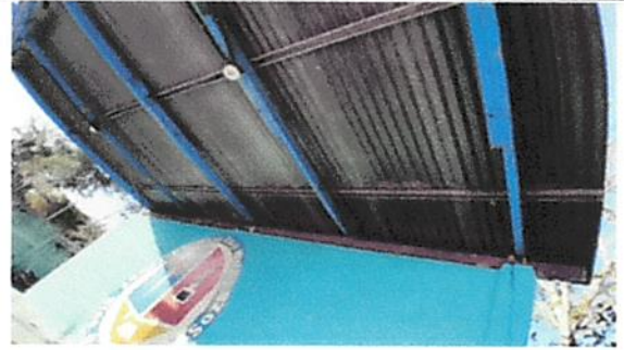
Foto 2: Sustitución de lámina, por lamina troquelada aluzinc calibre 26