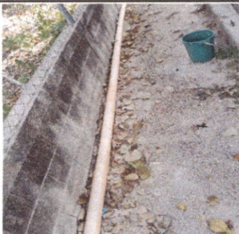
SUSTITUCIÓN DE TUBO PVC LINEA PRINCIPAL AGUAS NEGRAS