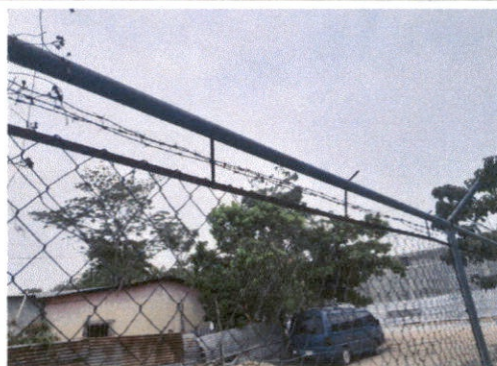
REPARACIÓN DE CERCO DE ALAMBRE DE PUA

Observación: Si es necesario se pueden agregar hojas adicionales y actualizar el número de hojas.