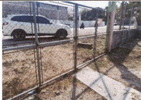
SUSTITUCIÓN DE PORTON DE METAL

Observación: Si es necesario se pueden agregar fotos para actualizar el número de hojas.