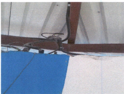
SUSTITUCIÓN DE DUCTO MAS ACCESORIOS