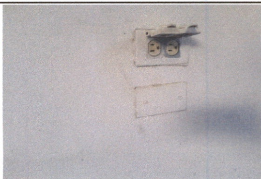
SUSTITUCIÓN DE TOMACORRIENTES DOBLE