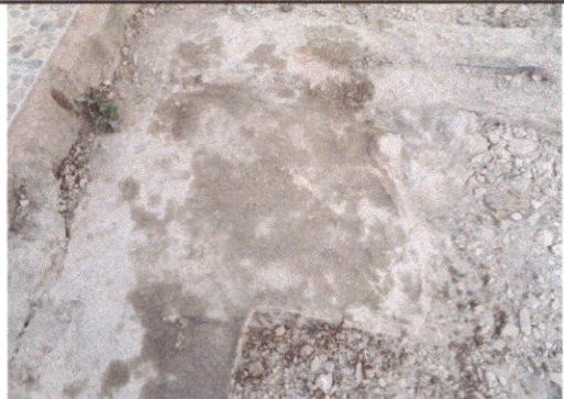
SUSTITUCIÓN DE TORTA DE CONCRERTO