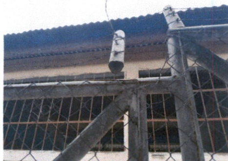
REPARACIÓN DE TUBO HG Y MALLA GALVANIZADA