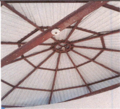
SUSTITUCIÓN DE LAMPARAS TIPO LED