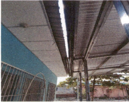
SUSTITUCIÓN DE CANAL DE METAL