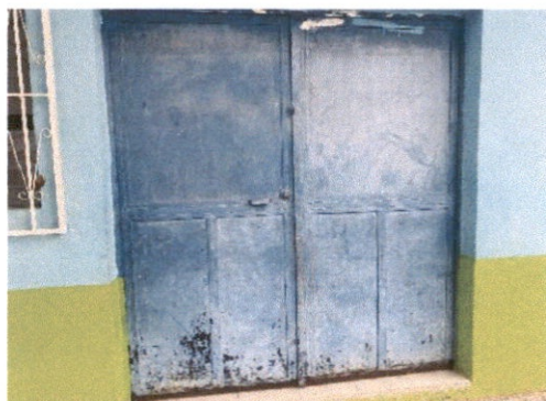
MANTENIMIENTO A ESTRUCTURA DE METAL