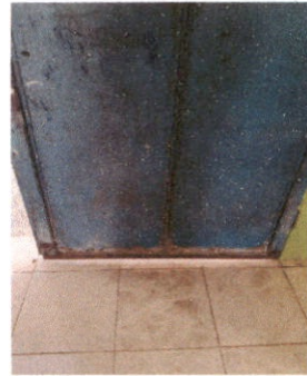
SUSTITUCIÓN DE PUERTA