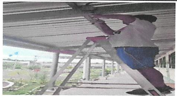
SUSTITUCIÓN DE REFLECTORES LED