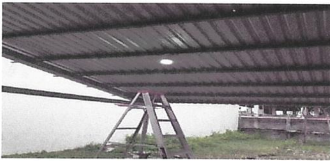
SUSTITUCIÓN DE CABLEADO PRINCIPAL