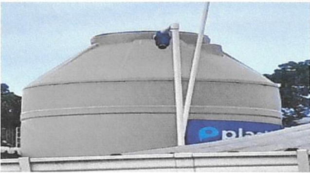
SUSTITUCIÓN DE ACCESORIOS DEPOSITO DE AGUA