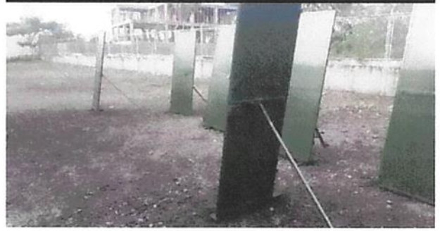
MANTENIMIENTO A PUERTAS