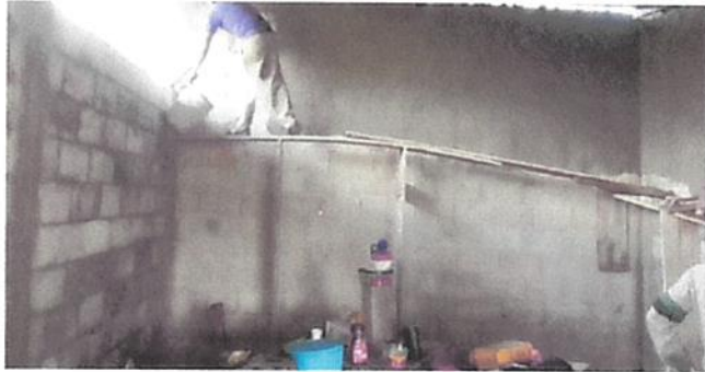
REPARACIÓN DE MURO DE CONTENCIÓN