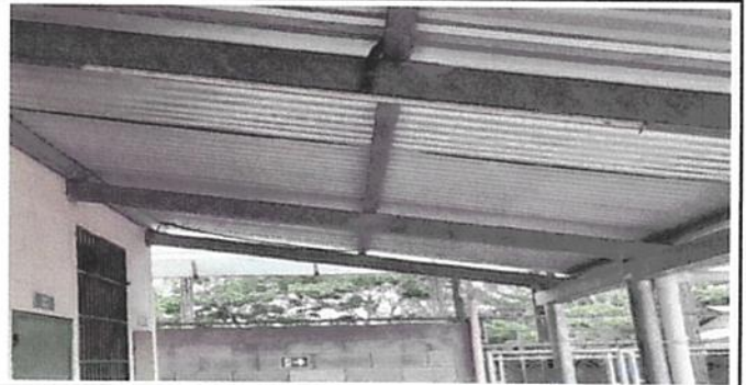
SUSTITUCIÓN DE PLAFONERA

Observación: Si es necesario se pueden agregar hojas adicionales y actualizar el número de hojas.