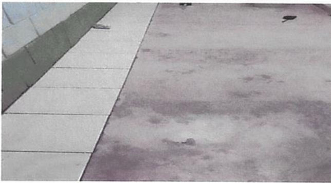
SUSTITUCIÓN DE CERÁMICA