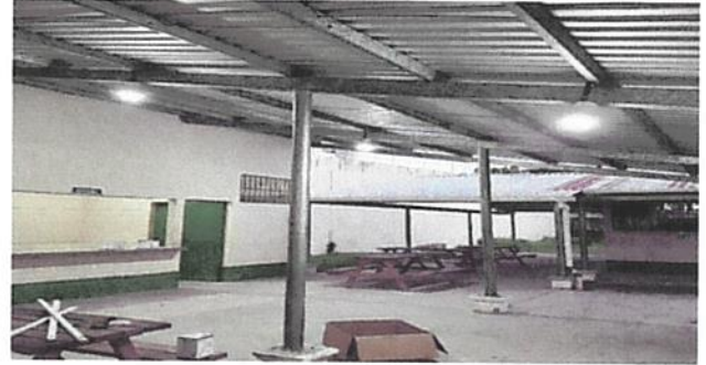
SUSTITUCIÓN DE BALCON