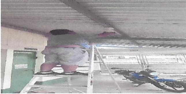
SUSTITUCIÓN DE FOCOS AHORRADORES