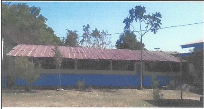
Foto1: Sustitución de lamina por lamina troquelada aluzinc calibre 26