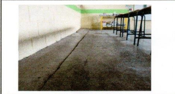
Foto 1: Angulo desde donde se observa una de las partes del piso con grietas.