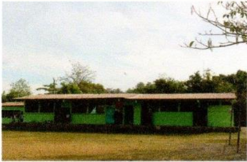
Foto1: Sustitución de lámina por lámina troquelada