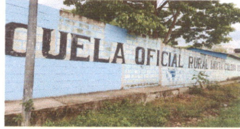
Pintura en muros exteriores e interiores.