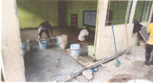
Sustitución de piso de torta de concreto.