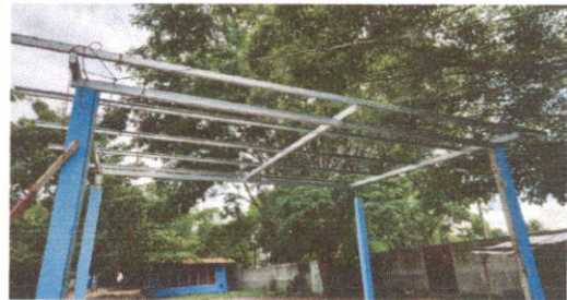
Sustitución de estructura de soporte de madera por metal.

Observación: Si es necesario se pueden agregar hojas adicionales y se debe indicar el número de hoja.