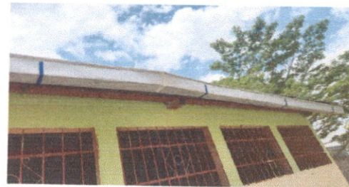
Sustitución de canal de metal.

Observación: Si es necesario se pueden agregar hojas adicionales