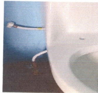
Sustitución de accesorios (contrallaves)