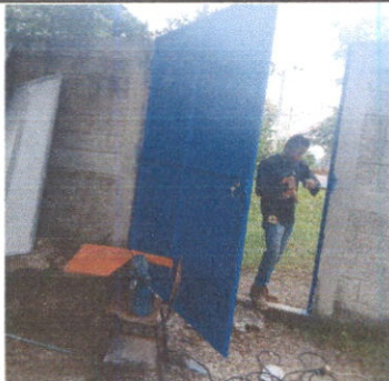
Sustitución de portón de metal