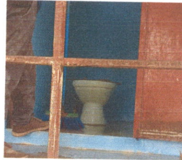
Sustitución de Inodoros.