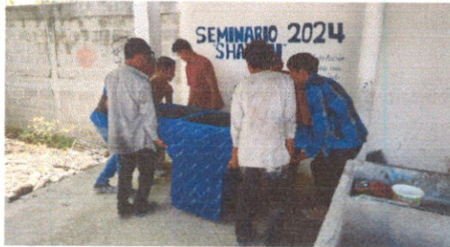
Sustitución de pila de cemento de dos lavaderos