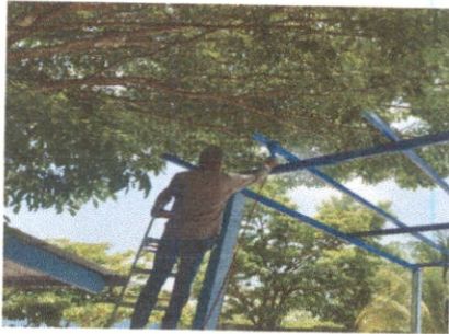
Mantenimiento a estructura portante de metal.