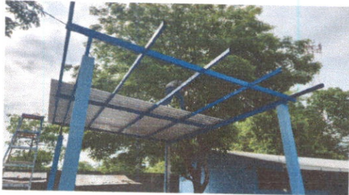
Sustitución de lámina, por lamina troquelada de aluzinc calibre 26. Desinstalación de lámina Existente.