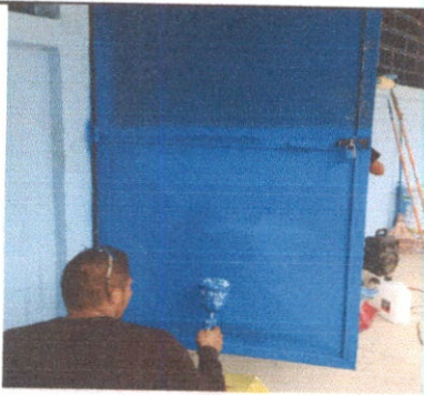
Mantenimiento a estructura (lijado, cambio de tubo , cepillado, sujeciones, aplicación de pintura)