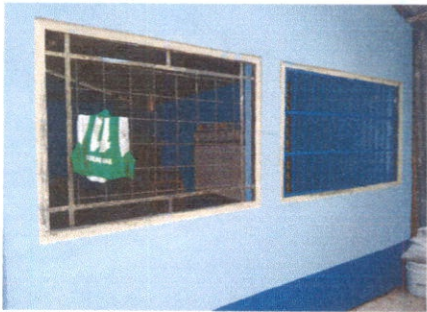
Fabricación e instalación de balcones de metal en ventanas