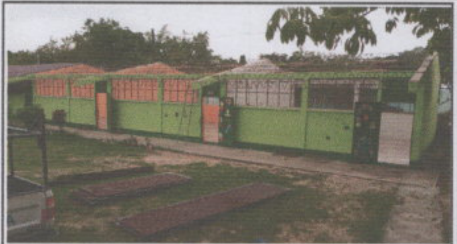
Foto 2: Aquí se puede observar la desinstalación de la lámina actual del proyecto de remozamiento.