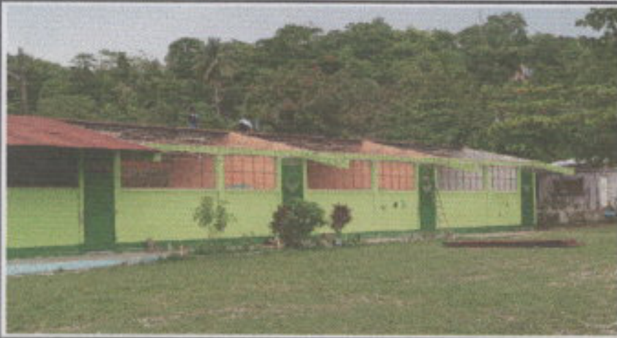
Foto 1: Realizando la desinstalación de la lámina actual de las tres primeras aulas.