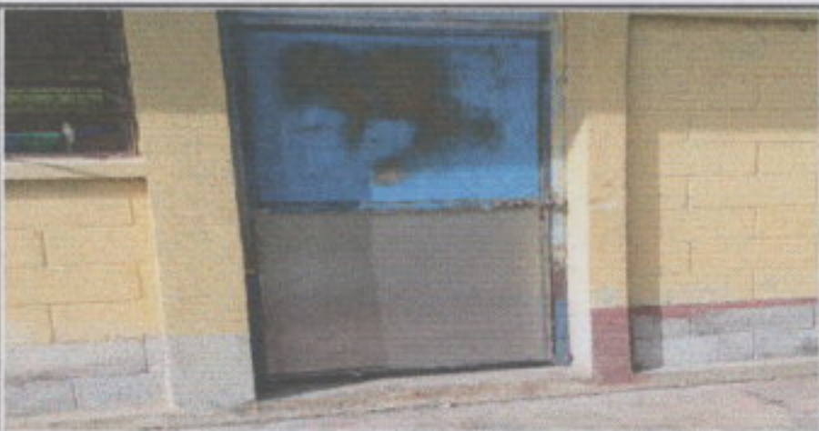
Foto 5: En esta fotografía se puede observar el mantenimiento a la puerta en lijado, cepillado a la estructura de la puerta.