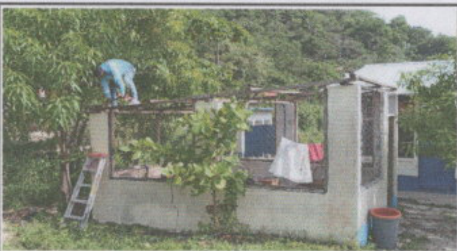
Foto 3: Realizando la desinstalación de la lámina actual de la cocina donde se preparan los alimentos escolares.