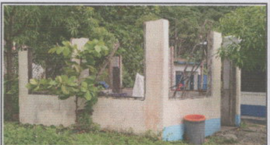
Foto 4: En esta fotografía se puede observar la desinstalación completa de la lámina actual de la cocina.