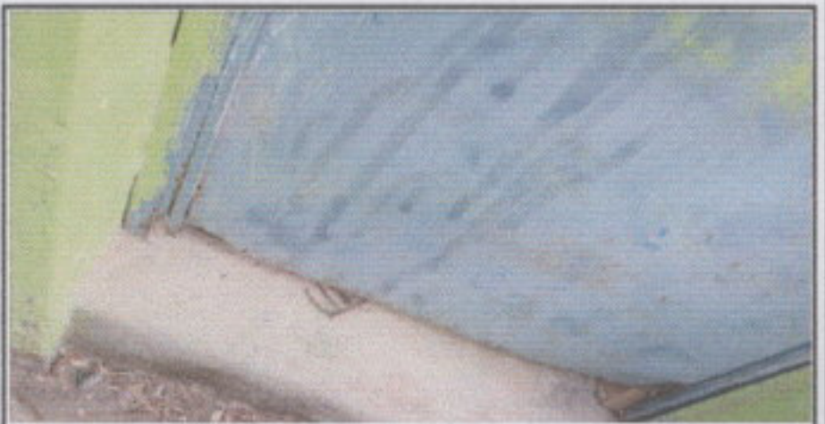
Foto 6: En esta fotografía se puede observar el deterioro de la estructura de la puerta a la cual se le dará mantenimiento para que quede como la puerta de la fotografía número cinco.

Observación: Si es necesario se pueden agregar hojas adicionales y actualizar el número de hojas.