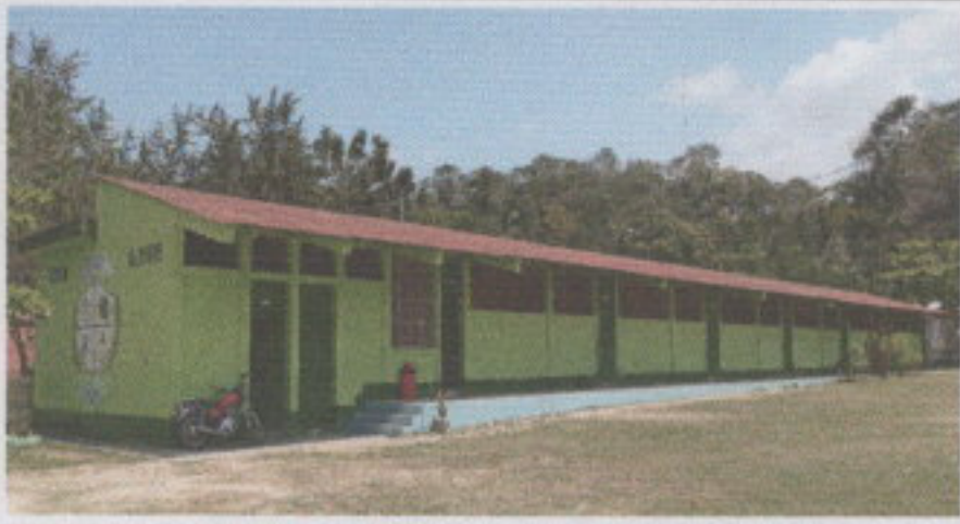
1.1. Sustitución de lámina, por lámina troquelada aluzinc calibre 26.