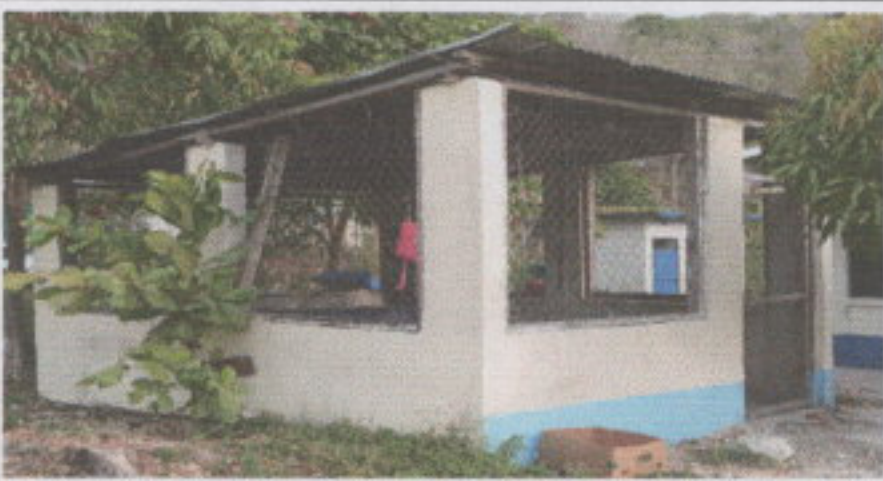
1.1. Sustitución de lámina, por lámina troquelada aluzinc calibre 26