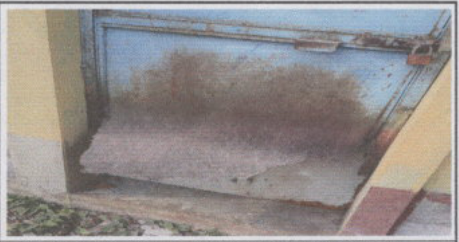
4.1. Mantenimiento a estructura (lijado, cambio de tubo , cepillado, sujeciones, aplicación de pintura).

Observación: Si es necesario se pueden agregar hojas adicionales y actualizar el número de páginas.