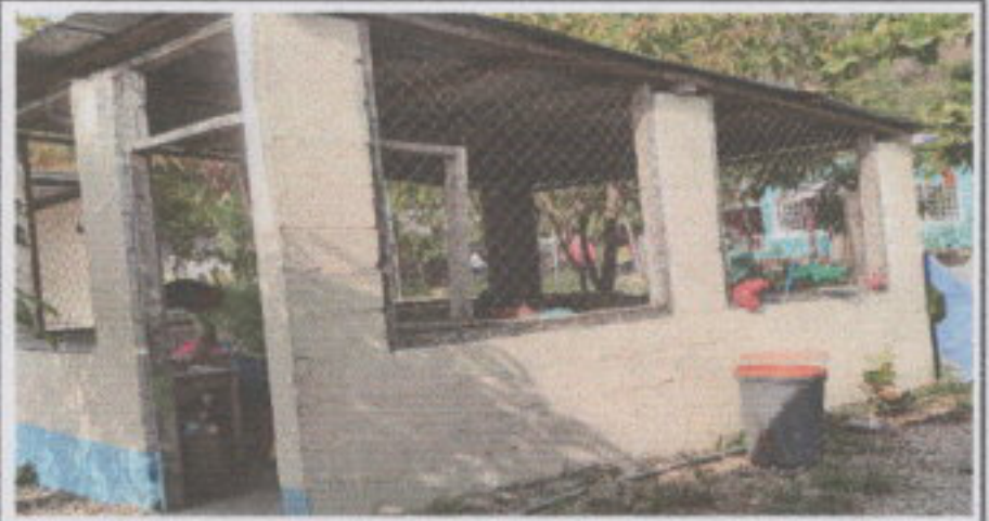
2.2. Sustitución de estructura de soporte de madera, por metal