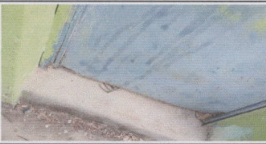
4.1. Mantenimiento a estructura (lijado, cambio de tubo , cepillado, sujeciones, aplicación de pintura)