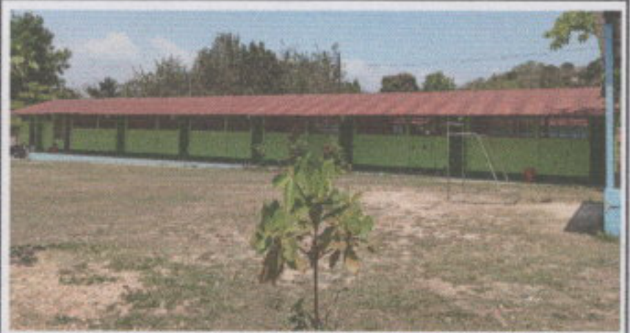
2.3. Sustitución de estructura de soporte de metal, por metal