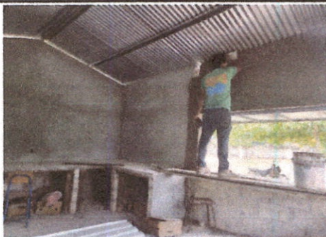
Foto 5: Renglon 21.2 Cernido en muro exterior e interior de la Cocina Escolar. Renglon 9. Pintura en exterior e interior de cocina