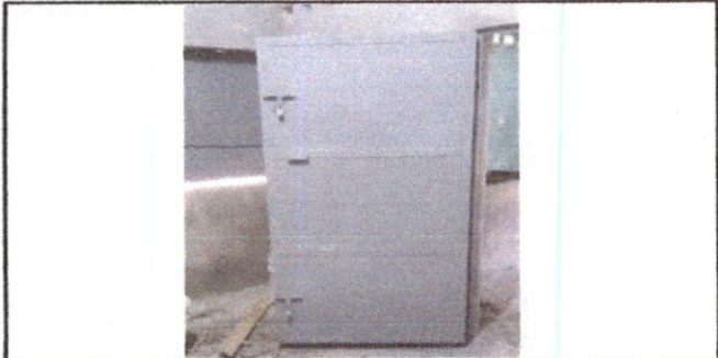
Foto: 7 Renglon 4. Sustitución de Puerta de metal.