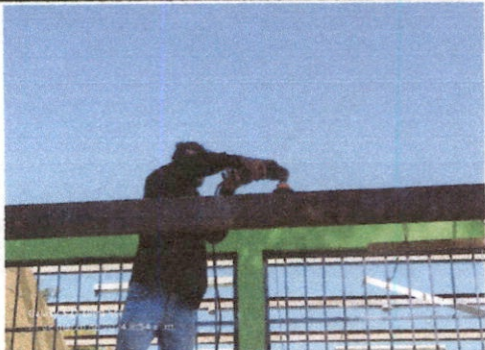
Foto 1: Renglon 2.2. Mantenimiento a estructura de soporte de metal en modulo 1 de la Escuela