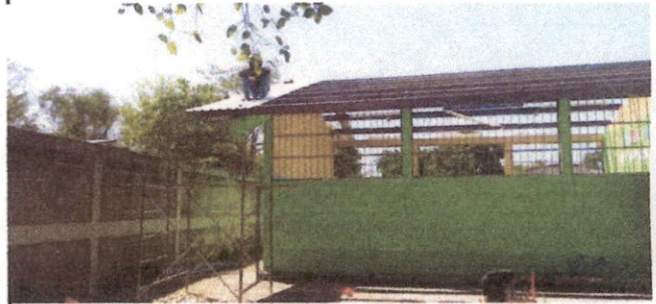
Foto 2: Renglon 1.1 Sustitución de lamina, por lamina troqueada aluzinc calibre 26 en el Modulo 1 de la Escuela