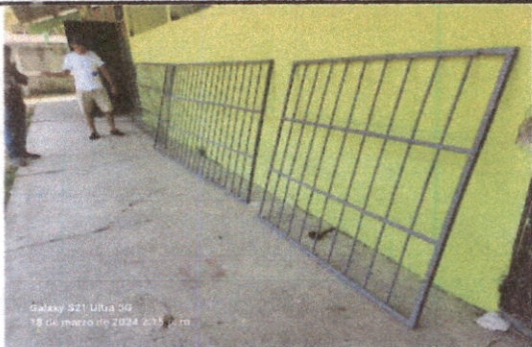
Foto 3: Renglon 5.6. Sustitución de balcones de metal en la parte de frontal y de atrás de las aulas del modulo 1