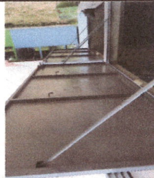
Foto 4: Renglon 19.1 Fabricación e instalación de ventanas en cocina escolar