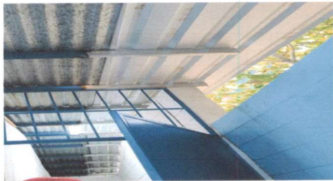
Foto 7. Sustitucion de estructura de soporte de metal por metal