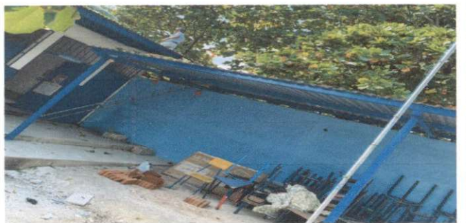
Foto 6: Sustitucion de lámina por la lámina troquelada aluzinc calibre 26

Observación: Si es necesario se pueden agregar hojas adicionales y actualizar el número.