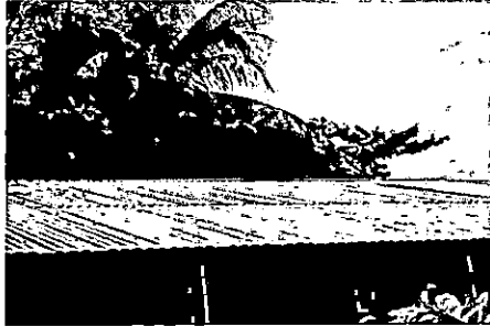
Foto1: Sustitución de lamina, por lamina troquelada aluzinc calibre 26.