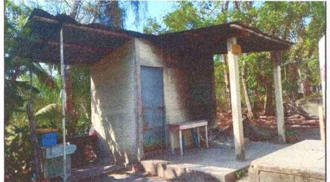
Foto 8: SUSTITUCIÓN DE LÁMINA POR LÁMINA TROQUELADA ALUZINC, CALIBRE 26. EN LA COCINA.