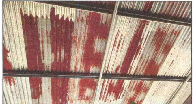
Foto 10: SUSTITUCIÓN DE LÁMINA POR LÁMINA TROQUELADA ALUZINC CALIBRE 26. EN EL CORREDOR.