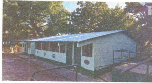
Foto 2: Sustitución de lámina, por lámina troquelada aluzinc calibre 26