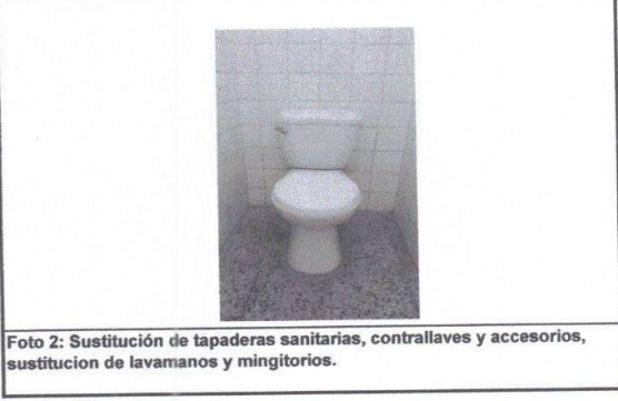
Foto 2: Sustitución de tapaderas sanitarias, contrallaves y accesorios, sustitución de lavamanos y mingitorios.