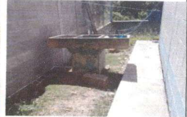
Foto 2: Sustitución de pila de cemento de dos lavadero / Reparación de Cocina