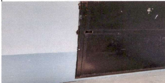
FOTO 2: Mantenimineto a estructura (lijado, cambio de tubo, cepillado, aplicación de pintura)