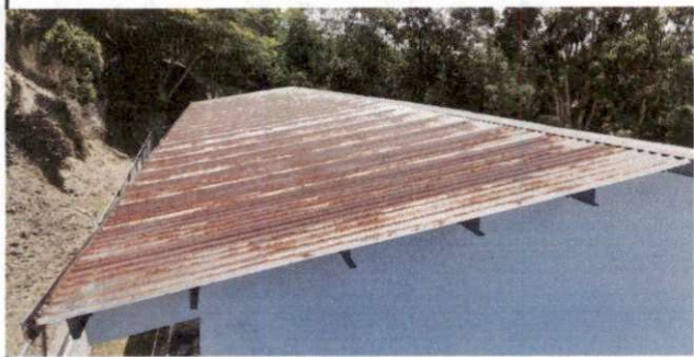
FOTO 1: Sustrucción de lámina, por lámina troquelada aluzinc calibre 26