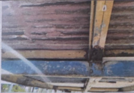
Foto 1: Sustitución de lámina, por lámina troquelada aluzinc calibre 26