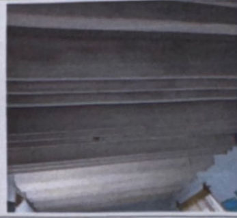
Foto 2: Sustitución de lámina, por lámina troquelada aluzinc calibre 26