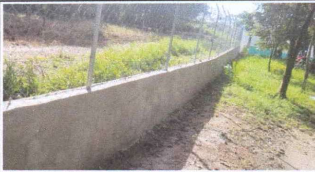
Foto1: Cernido en muro