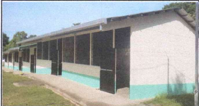
Foto 4: Mantenimiento a estructura (lijado, cambio de tubo , cepillado, sujetiones, aplicación de pintura)