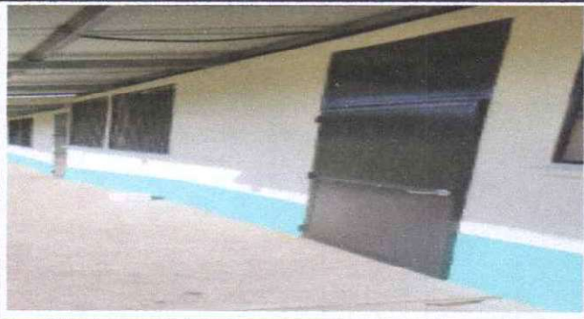
Foto 3: Mantenimiento a estructura (lijado, cambio de tubo , cepillado, sujetiones, aplicación de pintura)